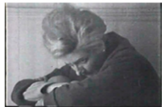
Sec. 19, F. 21

Efectivamente, el shock traumático de la sec. 6 cobrará relevancia en la sec. final, derivado del dolor por el encuentro de la adulta consigo misma, con una casa vacía, un espacio cuyas paredes “le costaba tanto trabajo reconocer”, según exclama en la sec. 19. Así como reconocerse a sí misma como adulta antes de asumir y redefinir su identidad de exiliada, a la que alguna vez -“hace veinte años”- le arrebataron la infancia. Lo percibimos en las frases que lanza al final mientras se escucha La verbena de Pamplona : “- Mamá, ¿por qué soy yo tan alta si sólo tengo 7 años? (...) - Mamá... no me dejéis aquí en el balcón (...) - ¿Por qué he crecido tanto? ¿Cuándo he crecido tanto?”.