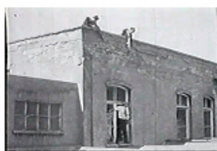
Sec. 2, F.5

Así, el fuera de campo, más que referir en este caso a la acción de la diégesis ejecutada al margen del plano, materializa la subjetividad de esas emociones regidas por la pérdida y el vacío, constante en las ventanas que abandona la niña cuando en la sec. 2 grita a la madre que “la guerra ha venido” y queda un profundo hoyo en el espacio que anuncia el vacío del exilio. De igual forma en la sec. 14, que muestra el origen de la música, luego de que Gabriela acostada en su cama mira en el techo rayos de luz como surgidos de un proyector de cine - ¿acaso no es el arte que mejor representa los sueños de la memoria?- y se asoma a otra ventana del edificio. Pero, con todo, lo más importante es lo que no vemos. Ahí se encuentra aquello que lleva a experimentar la nostalgia, pronto reforzada con la fugacidad de una imagen similar en la siguiente secuencia, ya durante el exilio (ver F. 17 y 19).