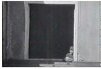
Sec. 2, F.6