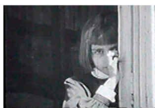
Sec. 2 F.3