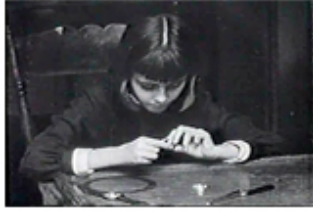
Sec. 2, F.1