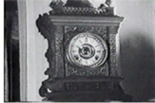
Sec. 6 F.10