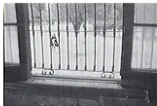
Sec. 6, F. 12