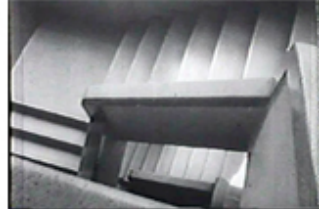
Sec. 15, F. 18