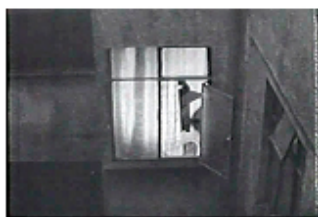
Sec. 14, F. 17