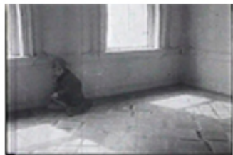
Sec. 19, F. 20