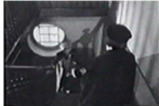
Sec. 19, F. 19