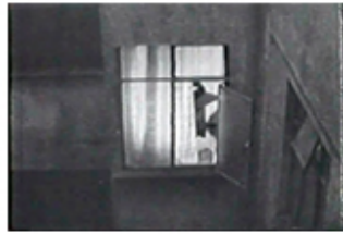
Sec. 14, F. 17