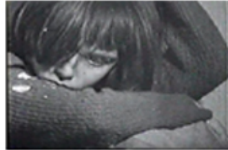
Sec. 6 F.15