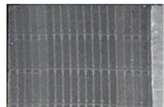
Sec. 6, F. 13