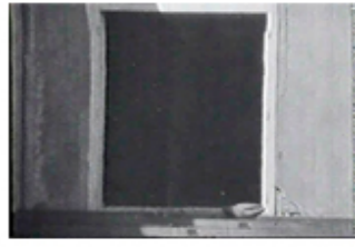
Sec. 2 F.7