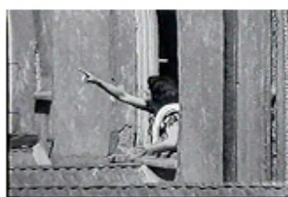
Sec. 2, F.4