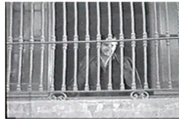
Sec. 5, F. 9