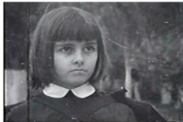
Sec. 5, F. 8

Podemos ver que el estrato de las sec. 5 y 6, funge como punto de engarce del recuerdo de lo real y lo simbólico al que se anclará la añoranza del pasado en el presente, aquello ausente como el balcón vacío que deja el hombre luego que lo han asesinado.