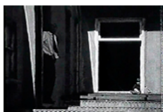
Sec. 2, F.2

juguetes que quedan en campo y Gabriela -fuera de campo-, quien sin saberlo va al exilio (sec.7). De igual forma la pérdida del padre que sólo aparece en la primera secuencia y del que olvida casi todo, como dicta en la sec. 11: “Y pensé entonces en la cara de mi padre. Y vi que también me había olvidado de ella. Y busqué su sonrisa, y sus ojos, y su frente, pero no encontré nada”.