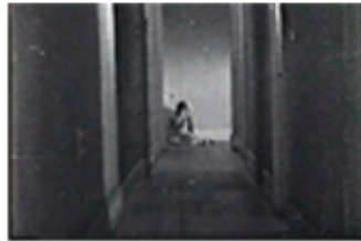
Sec. 6, F.14

(Y más adelante) -“Pero yo seguía encogida en aquél pasillo, con mi miedo ahí tan grande, en un cuerpo tan chico para aguardarlo [...]”.