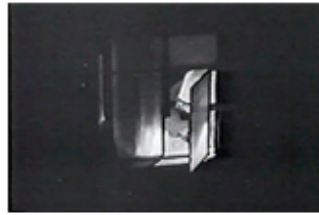
Sec. 15, F. 19

Finalmente, hablamos de un vacío incrustado en la memoria que intenta llenar y reconstruir, ya siendo adulta, con imágenes que no narran; por el contrario, surgen por asociación simbólica que sutura el pasado y el presente a través de un tiempo y una historia mítica que pudo haber sido y que, como todo mito y todo recuerdo, mantiene un pie en la verdad y otro en la mentira.