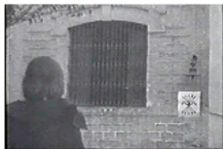
Sec. 6, F. 11