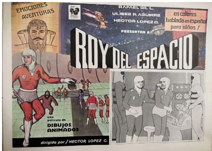
FIGURAS 4-7. Lobby cards de Roy del Espacio (1983).