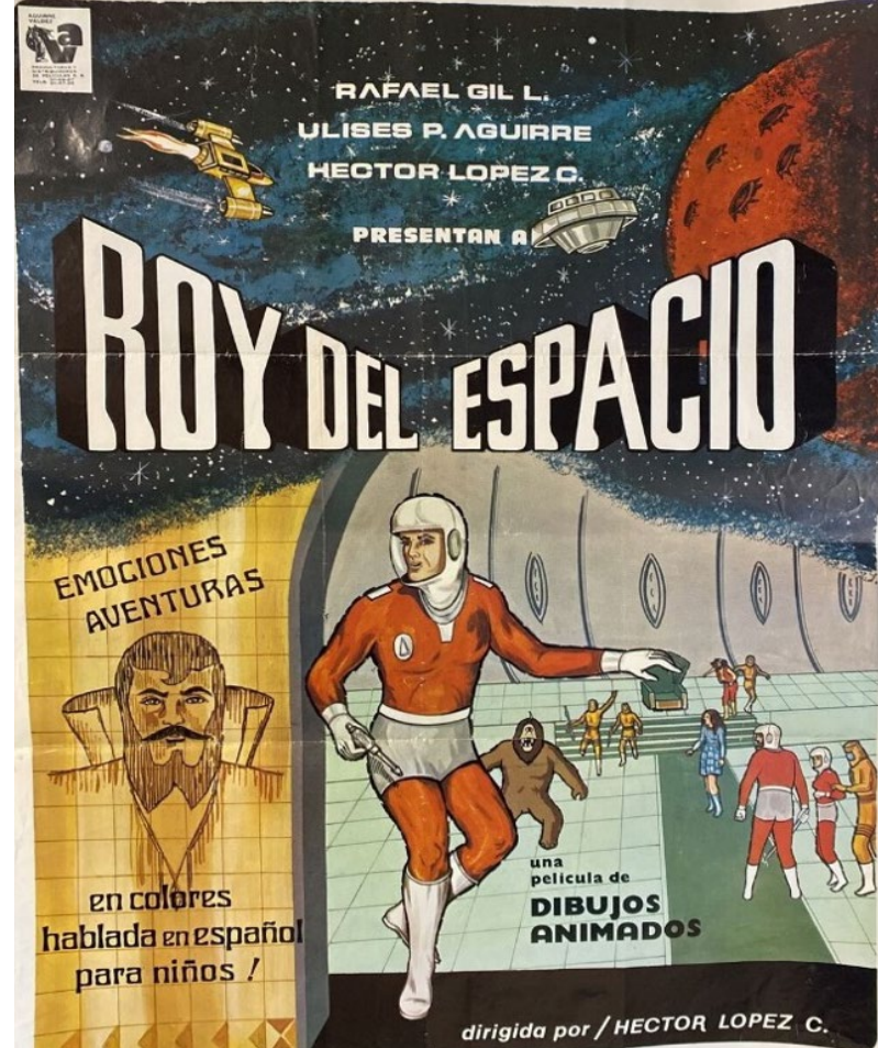
FIGURA 3. Póster de tamaño completo de Roy del Espacio (1983).