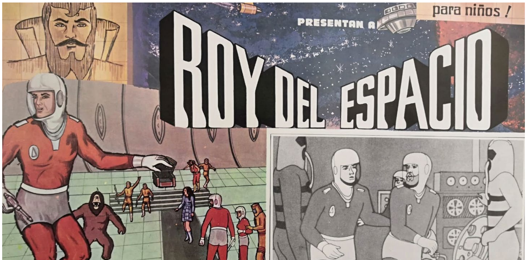
FIGURA 1. Roy del Espacio (Héctor López C., 1983) [Extracto de lobby card].