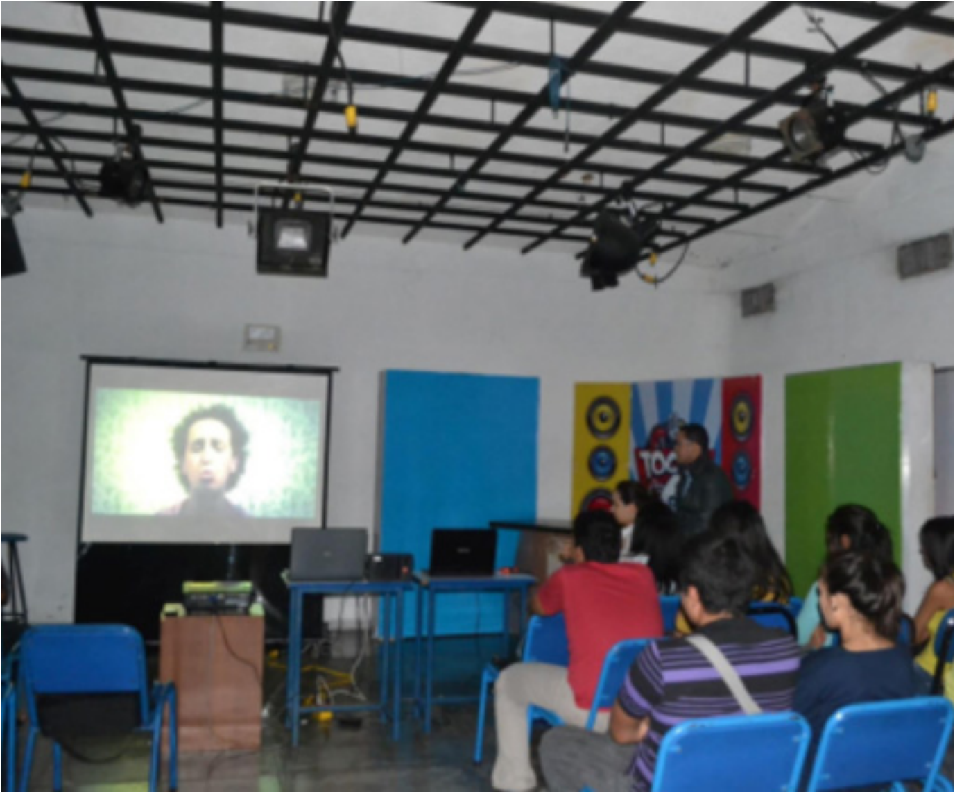
FESTIVERD en la UBA, estado Aragua