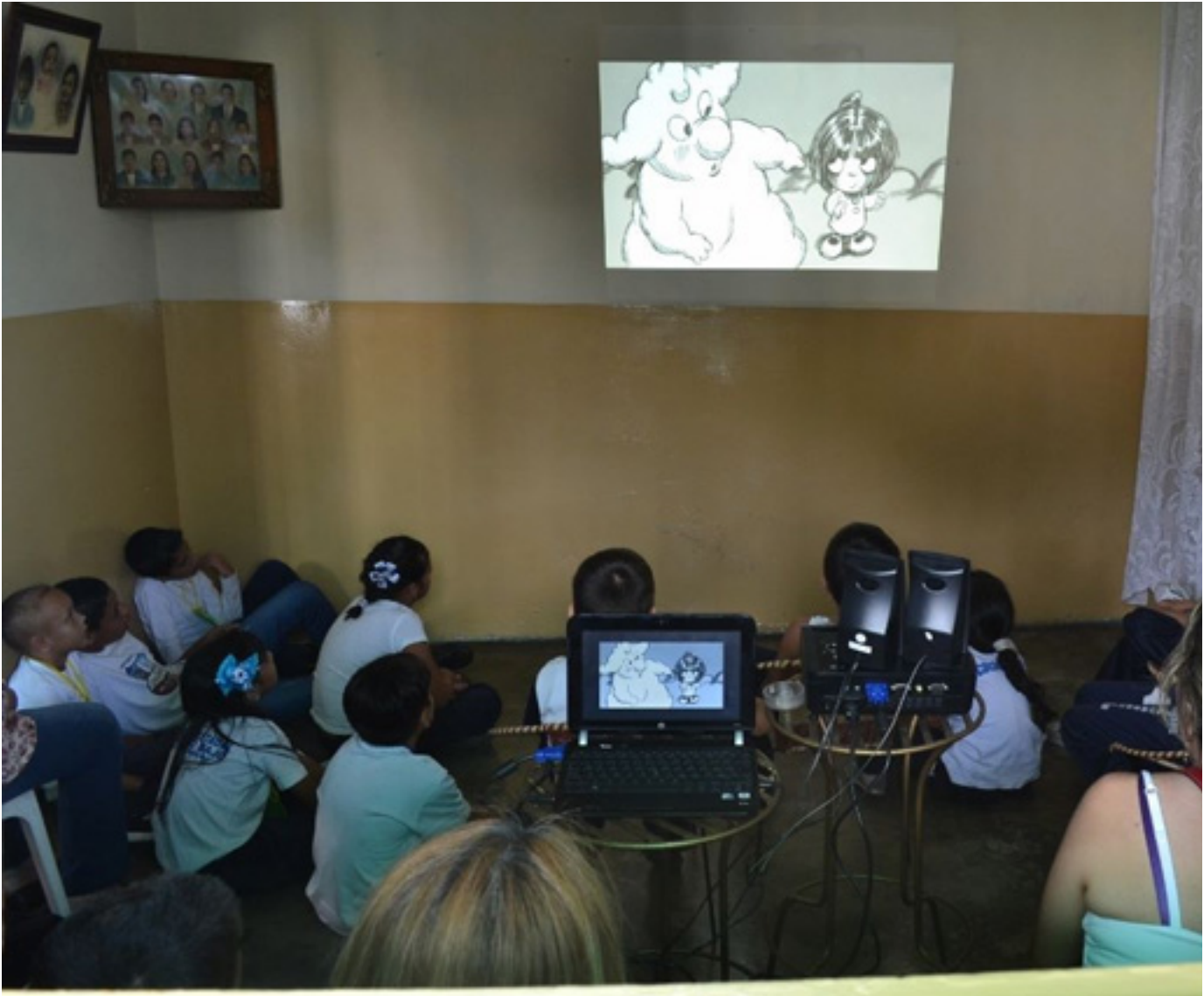
FESTIVERD en la Comuna de EJIDO, estado Mérida