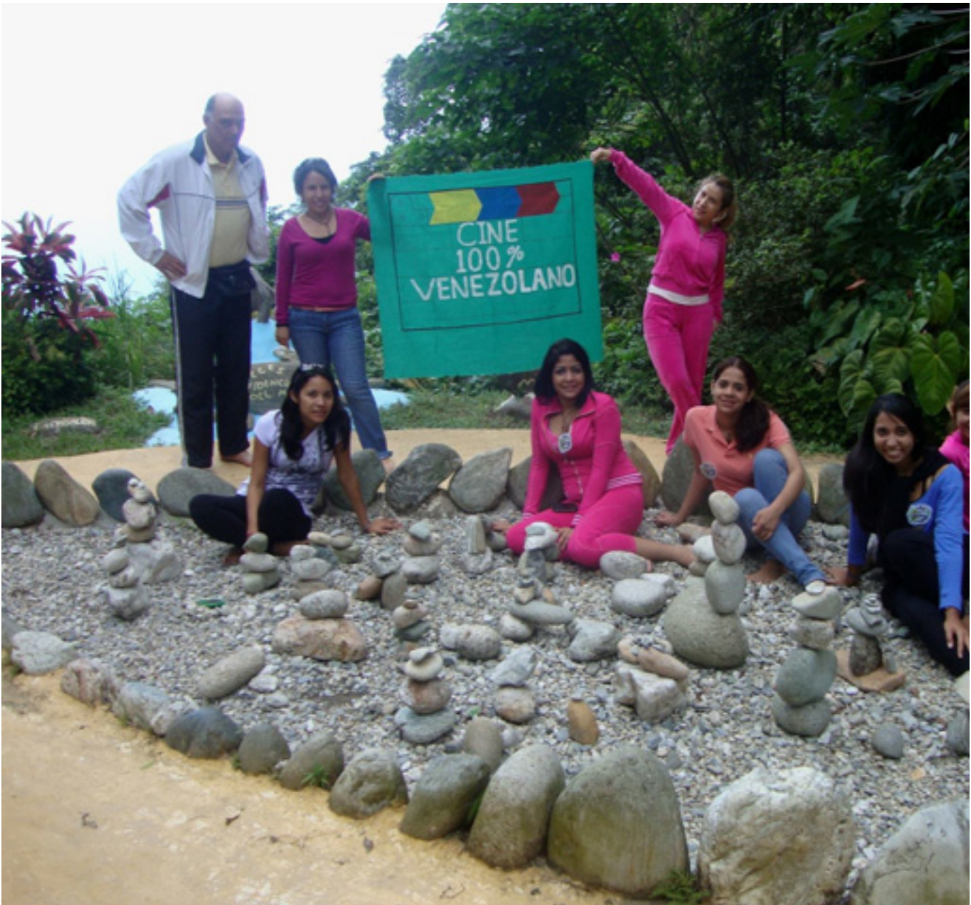
FESTIVERD, en el Museo de Arte Ecológico, Galipán

El I Festival Internacional de Cine y Video Verde de Venezuela (FESTIVERD), fue organizado por la Asociación Civil Cine 100% Venezolano, encargada de investigar y difundir la cinematografía nacional, además de organizar festivales nacionales e internacionales. Contó con el apoyo de diferentes organizaciones: dos empresas públicas, ocho empresas privadas, cinco organizaciones no gubernamentales y cuatro centros educativos (escuelas y universidades).