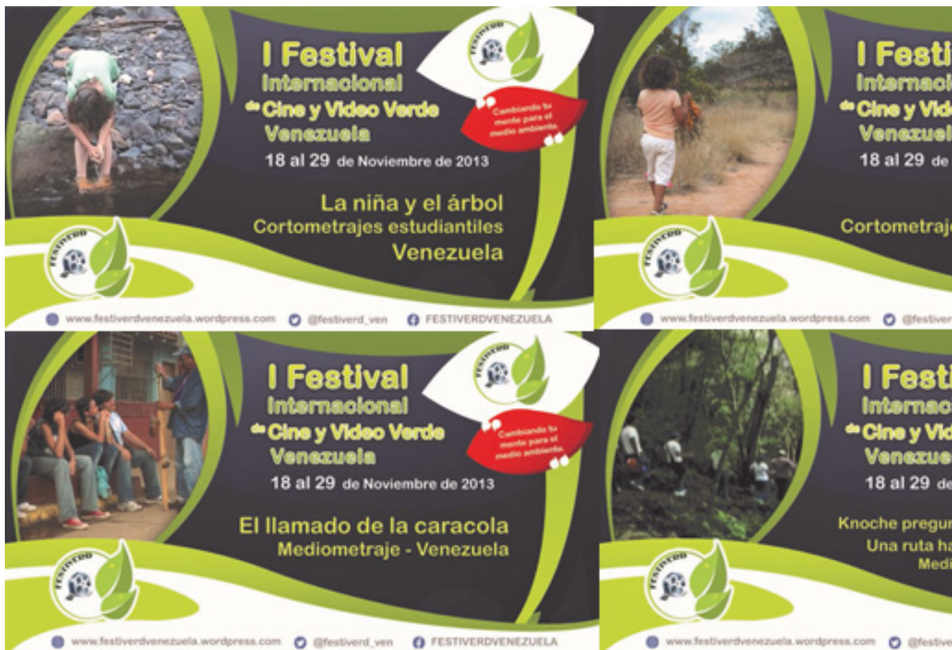
Selección de Venezuela en FESTIVERD, 2013

llamado de FESTIVERD logró obtener la atención de 4% de estas a través de su cuenta de mail ( festiverdvenezuela@gmail.com ), página web ( http://festiverdvenezuela.wordpress.com/ ) y redes sociales virtuales (Twitter: @FESTIVERD_VEN; Facebook: FESTIVERDVENEZUELA ). El festival contó con más de 140 producciones cinematográficas de diferentes latitudes del mundo, fueron seleccionadas 17 obras cinematográficas para competir: 4 cortometrajes estudiantiles, 10 cortometrajes profesionales y 3 medimetrajes. De las 17 producciones audiovisuales en competencias, solo cuatro obras cinematográficas correspondían a Venezuela (foto 5): 1 cortometraje estudiantil, 1 cortometraje profesional y 2 medimetrajes. Una buena representación para un buen comienzo. Koridel , un cortometraje profesional documental de Carlos Gómez de la Espriella del año 2011, obtuvo el premio del público.