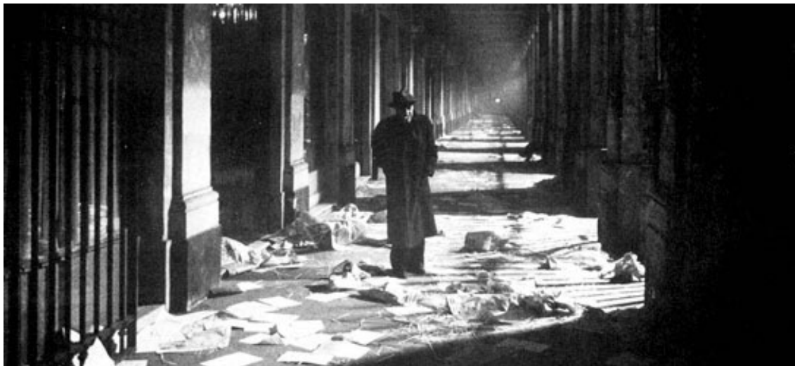
Tangos. El exilio de Gardel (1986), de Fernando Solanas

destacable. Su militancia política era indisimulable en una reseña o una entrevista; comprometido como Kuhn, pero con un pasado revolucionario políticamente censurable en el momento de la transición democrática. El regreso de Denti pasó inadvertido.