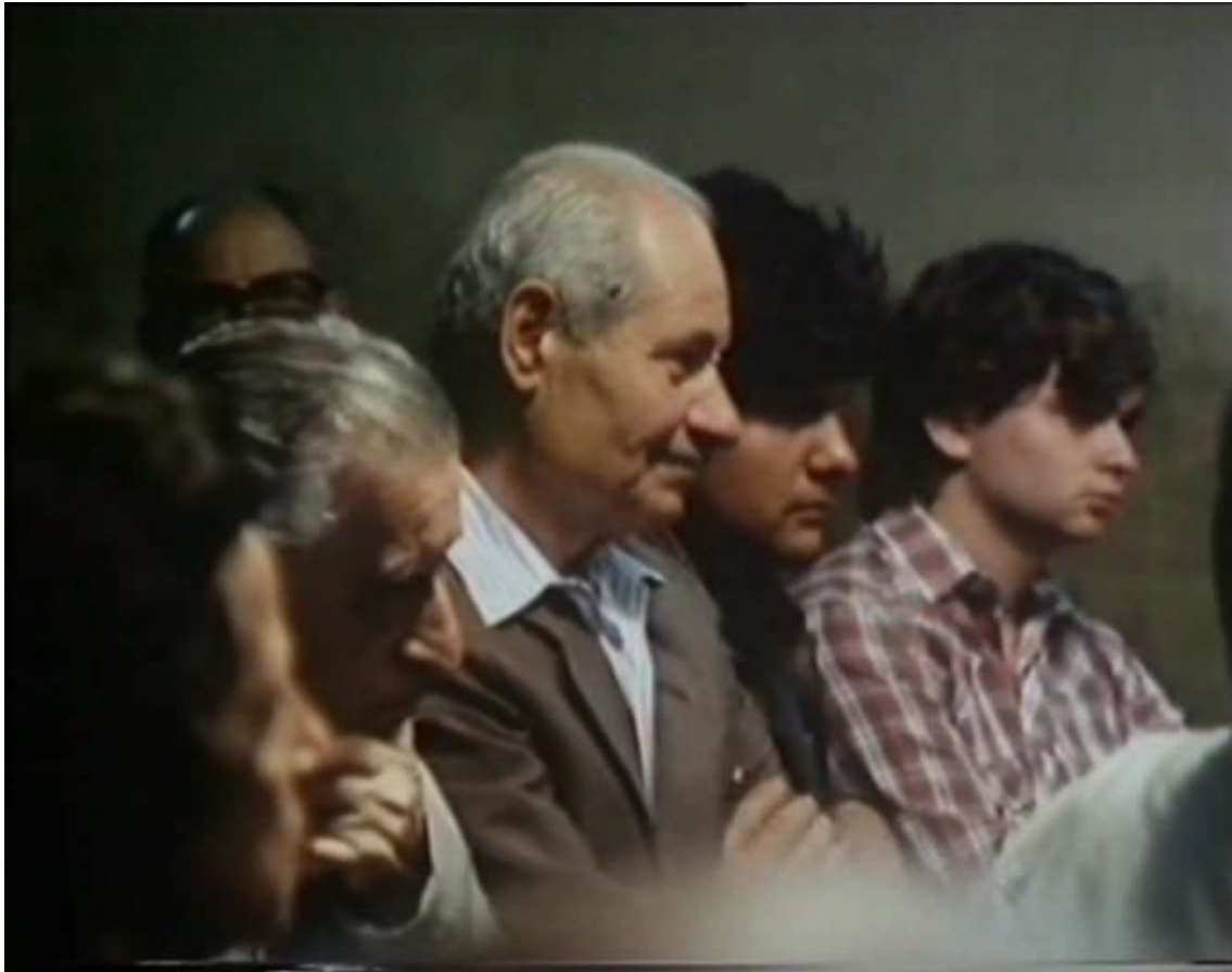
Cuarentena. Exilio y regreso (1983) de Carlos Echeverría

Tangos... , así como Cuarentena... , "manifiesta su apuesta por la democracia, la tolerancia, la lucha por los derechos humanos" (Jensen, 2005, p. 197). Al mismo tiempo este retorno "es visto como el inequívoco fracaso de los militares", que habían "triunfado" momentáneamente cuando se produjo el exilio de millares de personas (Jensen, 2005, p. 185). Aunque para el caso de Echeverría y su film sea necesario destacar algunas diferencias con Solanas. El director que regresa de Alemania está estudiando allí y no ha sido un exiliado, su protagonista (Bayer) no era militante de ninguna agrupación política aunque fue perseguido y su libro Los vengadores de la Patagonia trágica fue censurado. Mientras que Solanas sí había salido del país como exiliado, y había codirigido un grupo de cine militante (Cine Liberación) de relaciones fuertes con el Movimiento Peronista. [13] Es decir que, si bien ambos films comparten sus esperanzas en la democracia y en el respeto por los derechos humanos en esta nueva era, las trayectorias de sus hacedores no fueron idénticas.