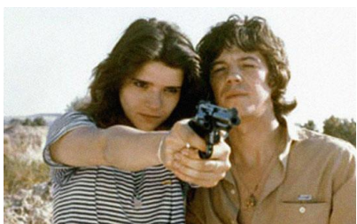
Deprisa, deprisa , (C. Saura, 80)

En la tercera parte de Los hijos de la calle , el autor presenta filmes realizados de 1990 a 2003, que tienen que ver con tres ejes temáticos: crimen-delinuencia, sicarios y niños de la calle. Los tópicos giran en torno a la pobreza y marginación social, la desintegración familiar, la orfandad, la drogadicción, el narcotráfico, la violencia y la explotación, entre otros. El autor se concentra en esta sección en la representación cinematográfica de una problemática que se ha venido agravando con la globalización: la marginalidad y tragedia de jóvenes desamparados, que no es sino una manifestación del desarrollo desigual de la mundialización de nuestros días. Es innegable que se ha agravado la situación de muchos jóvenes excluidos por el sistema económico, político y social que impera en la era neoliberal, incluso, se ha abierto para muchos de ellos la opción de formar parte del crimen organizado y de los cárteles de las drogas como una manera de supervivencia. El elemento comparativo sigue presente. Así, por ejemplo, en este gran juego de espejos construido por Vargas, los jóvenes contratados para asesinar en las calles de Medellín en La virgen de los sicarios (Barbet Schroeder, 1990) se dan la mano con La vendedora de rosas (Victor Gaviria, 1998) o los jóvenes delincuentes de Caluga o menta (Gonzalo Justiniano, 1990) en Santiago de Chile conversan con el Lolo (Francisco Athié, 1992) de la ciudad de México, y Lolo con el Pedro de Los olvidados (Luis Buñuel, 1950).