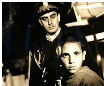
Crónica de un niño solo (L. Favio, 64)