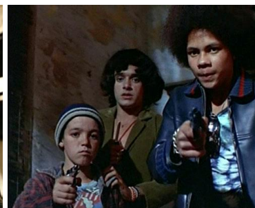
Pixote (H. Babenco, 1981)

En la segunda sección del libro, Vargas aborda la herencia del neorrealismo italiano en producciones iberoamericanas que van desde 1950 hasta 1981. En esta parte del libro, el autor traza la herencia e impronta de la poderosa corriente del neorrealismo italiano en los modos de producción y formulaciones estéticas en Iberoamérica a partir de la década de los 50. De esta manera, el historiador crea una red de vasos comunicantes entre estas tradiciones cinematográficas en donde dialogan los jóvenes marginales de El limpiabotas en Italia, Los olvidados de México y los argentinos de Crónica de un niño solo (Leonardo Favio, 1964), por citar algunos ejemplos. Esta dimensión comparativa es una constante a lo largo del texto. Los filmes neorrealistas ejercieron un profundo influjo en una América Latina que se enfrentaba al subdesarrollo económico, al éxodo de las poblaciones campesinas a las ciudades, al crecimiento de las ciudades con grandes cinturones de miseria y marginalidad, al abandono y explotación de muchos de sus niños y jóvenes. Con todo, es importante señalar que no se trató simplemente de importar el neorrealismo italiano a Iberoamérica, sino que Iberoamérica