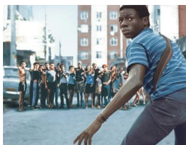
Cidade de Deus (F. Meirelles, 2002)