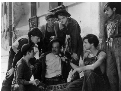
Los olvidados (L. Buñuel, 50)