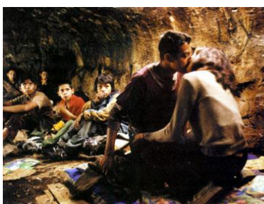
De la calle (G. Tort, 2001)

político en que se produce el filme en cuestión, luego, realiza un acucioso análisis del tema, ideología y estilo de la película; finalmente, incorpora a su evaluación observaciones y comentarios pertinentes de los especialistas que se han ocupado del filme a considerar, así como el impacto que tuvo el mismo a nivel de las audiencias y premios alcanzados en festivales. Las películas examinadas son las siguientes: Los olvidados , La escalinata , Río, 40 graus ; Tire Dié , Los golfos , Crónica de un niño solo , Largo viaje , Valparaíso, mi amor ; La Raulito , Soy un delincuente , Chuquiago , Gamín , Deprisa, deprisa ; Pixote: A lei do Mais Fraco ; Caluga o menta , Lolo , Sicario , Como nacem os anjos , Pizza, birra, faso ; Barrio , La vendedora de rosas , Huelepega , ley de la calle ; Ratas, ratones y rateros ; La virgen de los sicarios , De la calle , Cidade de Deus y El Polaquito . Las 27 películas estudiadas pertenecen a los siguientes países: México, Venezuela, Brasil, Argentina, Chile, Bolivia, Colombia, Ecuador y España. La mirada de Vargas va y viene de América Latina a Europa y de Europa a América Latina, sin dejar de hacer algunos atisbos a los Estados Unidos. Así, su investigación está marcada por una verdadera dimensión transatlántica.