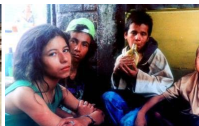
La vendedora de rosas (V. Gaviria, 98)

El detallado análisis de las 27 películas que integran Los hijos de la calle sigue de manera consistente un mismo esquema: primero, el autor brinda información del contexto social y