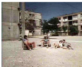
Caluga o menta (G. Justiniano, 90)